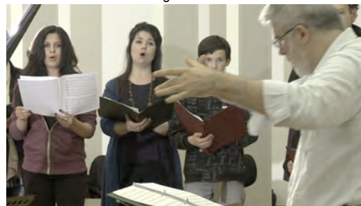
Flavio Colusso dirigiert